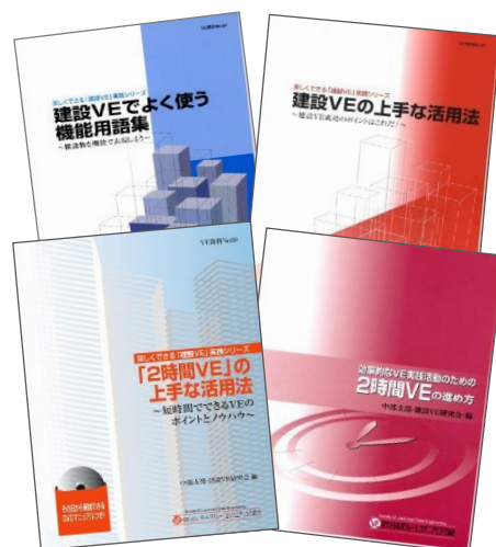
これまでに発行した研究報告書